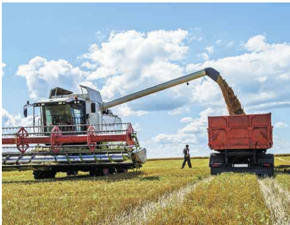
↑ Сельхозпроизводители готовятся к росту себестоимости своей продукции

«Мы сами вводим удобрения в почву, а потом думаем, как её восстановить. Люди стали использо-